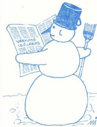
Mező István rajza

DIÁKNAPI KRÓNKA — Felelős kiadó: Endrész Gyöngyi . Felelős szerkesztő: Varga Koritár László . Felelős vez.: Wirth Lajos . Szerk.: Sárospatak, Eötvös u. 5.